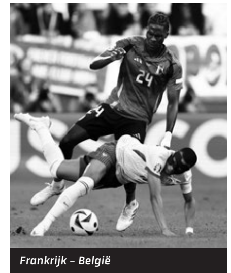
Frankrijk - België

vonden bijvoorbeeld België, Frankrijk en Engeland een puntje tegen een mindere tegenstander wel voldoende, "om maar de volgende ronde te bereiken", met als resultaat een zwaardere opponent te treffen in de volgende ronde of het risico te nemen dat er misschien toch een verdwaalde bal in zou ploffen en het feestje helemaal in rook op zou gaan. Eerstgenoemde twee landen namen het in de achtste finale tegen elkaar op, wat voor beiden vooraf natuurlijk geen gunstige