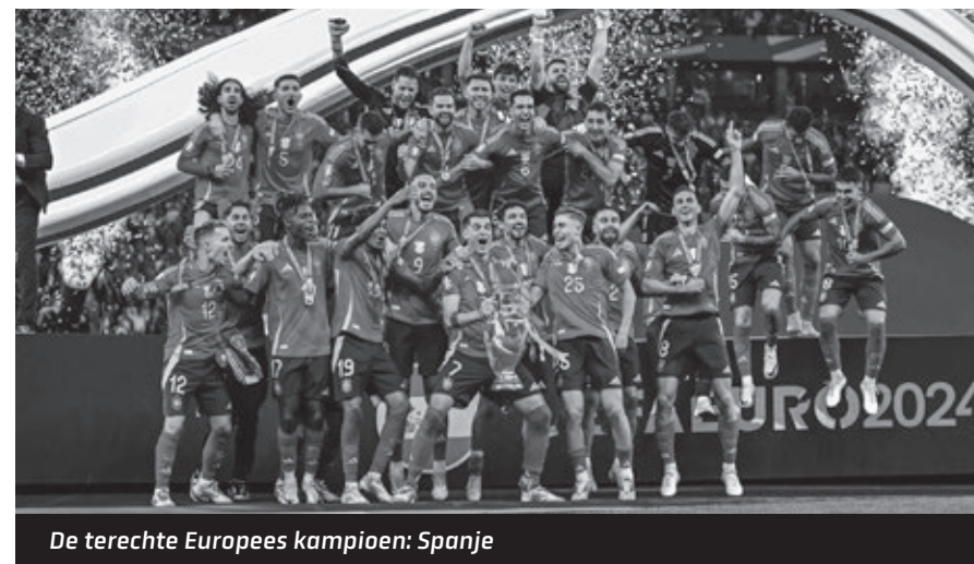
De terechte Europees kampioen: Spanje

– het Nederlandse succes uit vaderlands oogpunt even buiten beschouwing gelaten – dreigde dood te bloeden, toch nog met een mooie winnaar die het ook echt heeft afgedwongen. Op naar het volgende toernooi, als we in 2026 naar de Verenigde Staten, Canada en Mexico mogen om daar - hopelijk – deel te nemen aan een WK met voor het eerst in de historie liefst 48 deelnemers.