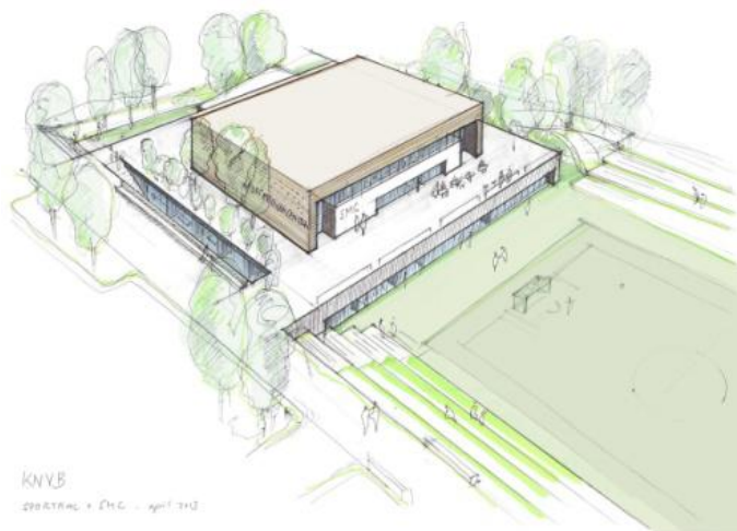
Impressie Sporthal/SMC en veld KNVB Campus

Als er niets gebeurt, moeten de verouderde gebouwen (rijksmonumenten) op het huidige KNVB-centrum alsnog een flinke renovatie ondergaan, met een aanzienlijk risico dat deze investeringen, zonder structurele commerciële exploitatie, niet worden terugverdiend. De KNVB zal ook extra kosten voor terreinonderhoud moeten dragen. En voor veel opleidings- en trainingsactiviteiten moeten uitwijken naar andere locaties, met oplopende kosten tot gevolg. En, onder meer, significante huurbaten zien wegvallen door een einde aan het contract met de exploitant van het KNVB Hotel (Compass Group).